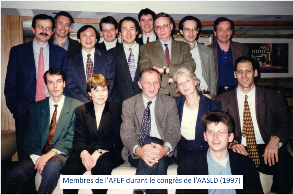
Membres de l'AFEF durant le congrès de l'AASLD (1997)

En 1997, la cotisation pour être membre de l'AFEF est de 400 francs par an.